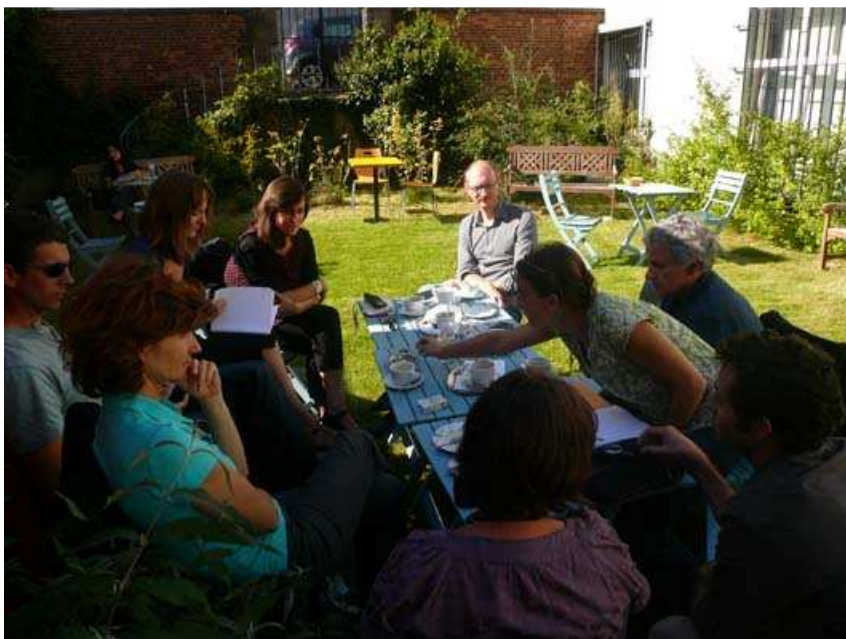
La cafétéria de Mundo Bruxelles côté jardin