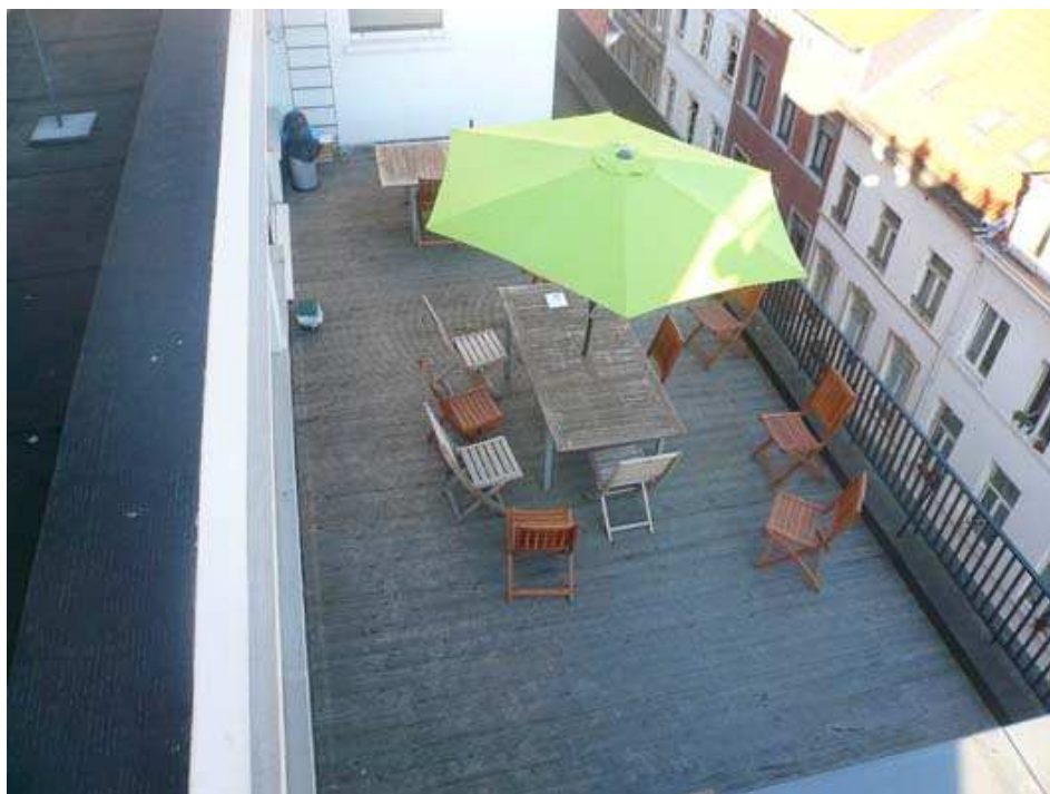
La terrasse des bureaux... pour profiter des rayons de soleil.