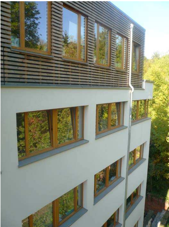
Le jardin se reflète dans les vitres du bâtiment.