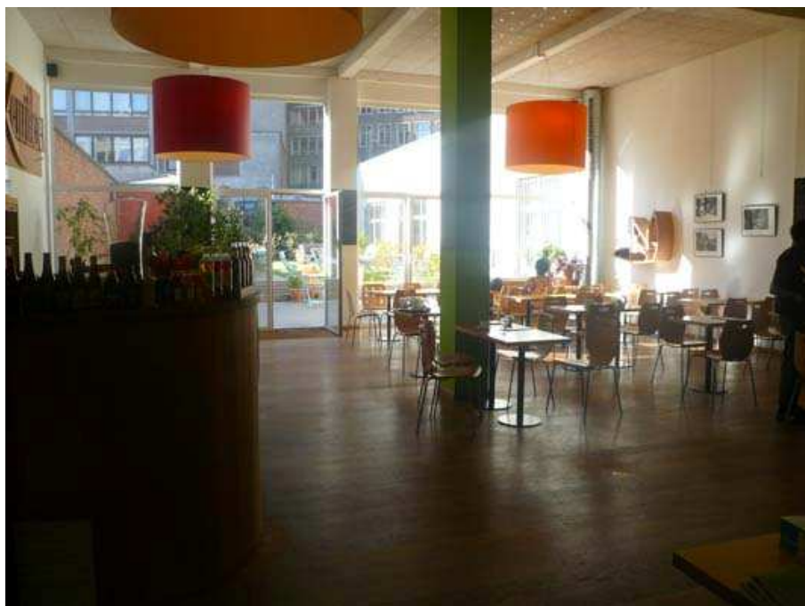
Intérieur de la cafétéria de Mundo Bruxelles où les résidents organisent des événements régulièrement.