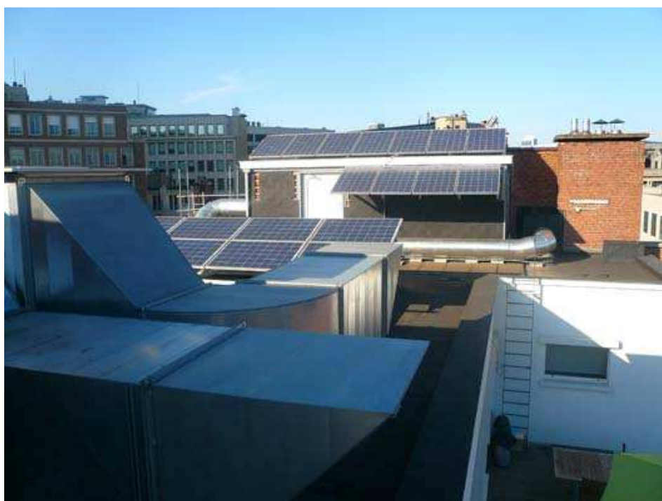
Sur le toit, produire de l'énergie solaire !