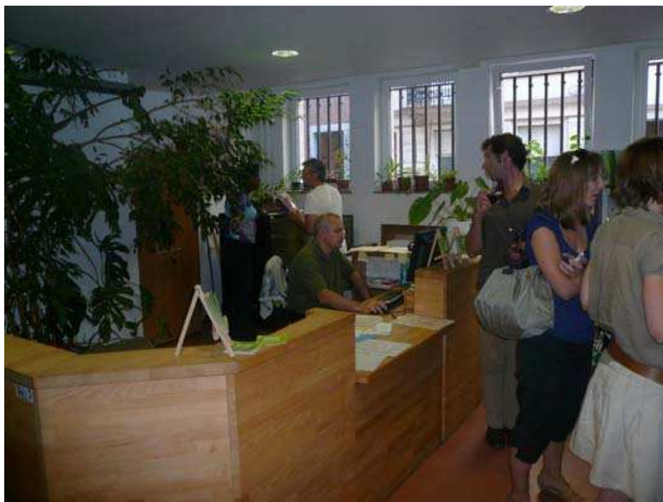
Le hall d'entrée avec l'accueil