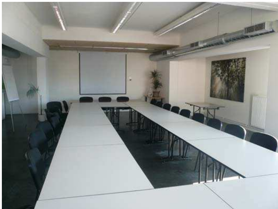
Une des salles de réunion