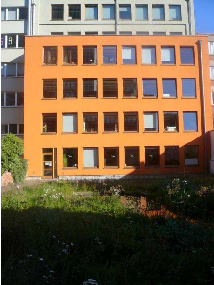
Une partie du bâtiment côté jardin