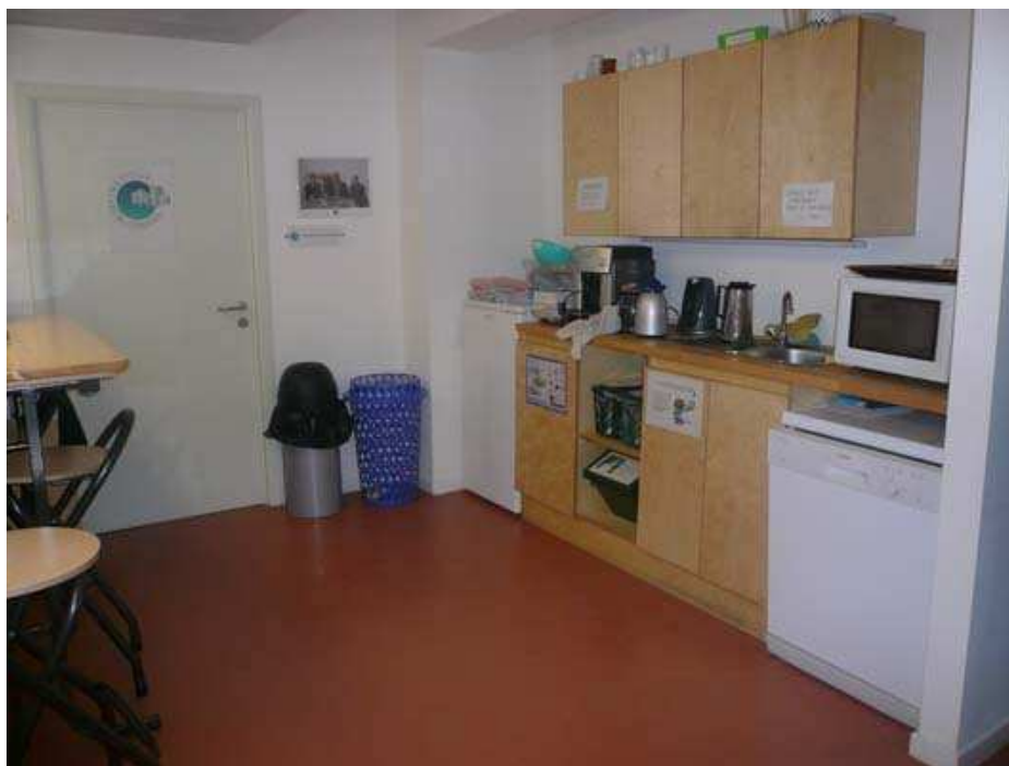
Les espaces 'kitchnette' mutualisés : 1 par étage