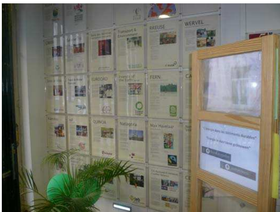
La liste des organisations résidentes à l'entrée du bâtiment