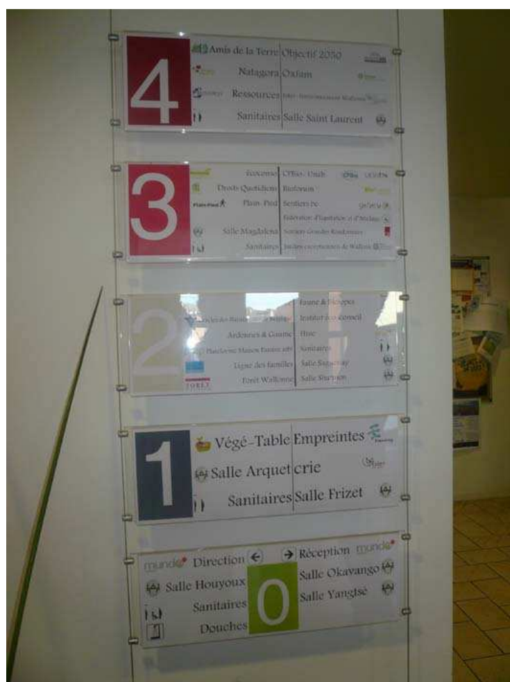
A l'entrée, un panneau qui indique les résidents par étage