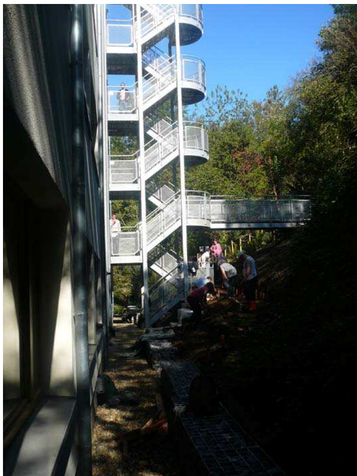
L'accès au jardin extérieur, mis en beauté par une association d'insertion par le travail