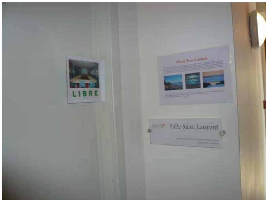
L'accès aux salles de réunion, aux noms de Fleuves lointains.