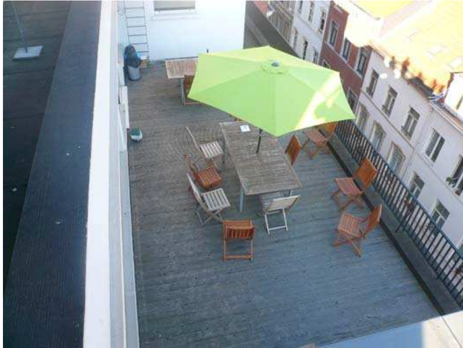
La terrasse des bureaux... pour profiter des rayons de soleil.