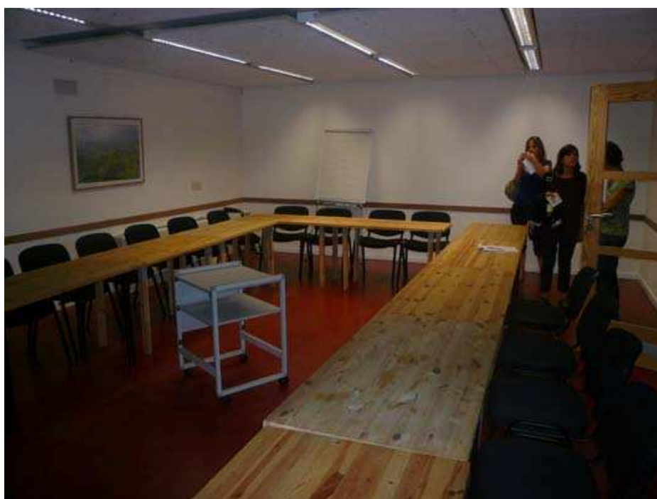
Les salles de réunion. 8 en tout d'une surface de 10 à 12m 2 et 2 salles de plus de 25m 2 . Et cela est parfois insuffisant pour répondre aux besoins des résidents.