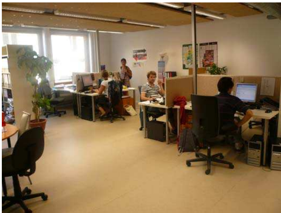
Les espaces de bureaux en 'open space'. On compte 7,5 m 2 par poste de travail