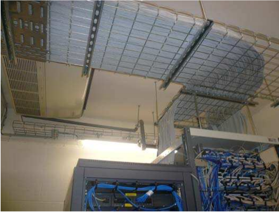
Et un serveur informatique également centralisé