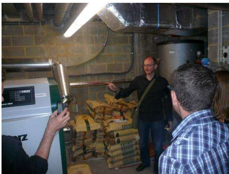
La chaufferie à granulés de bois centrale : 70 kw => chauffage par ventilation avec double flux et système de récupération de chaleur.