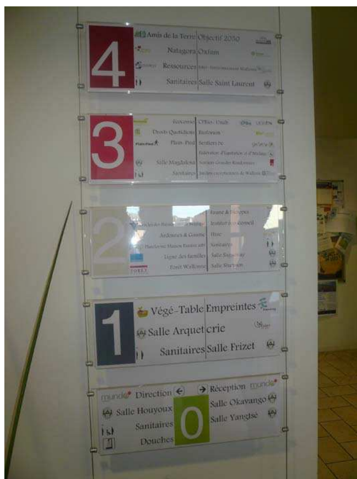
A l'entrée, un panneau qui indique les résidents par étage