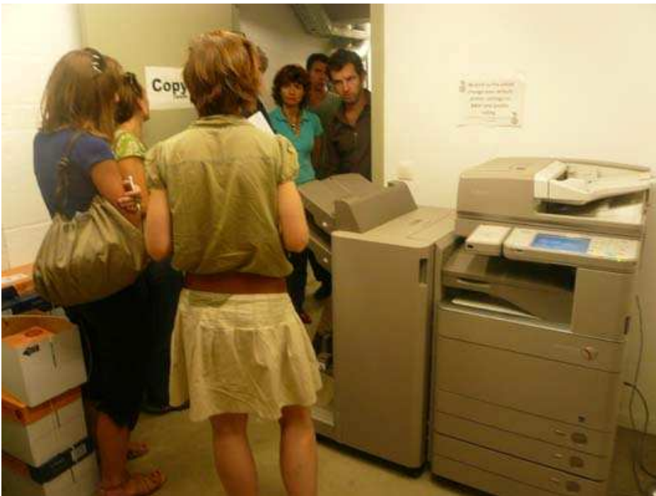
Les espaces mutualisés par étage : imprimante et photocopieuse...