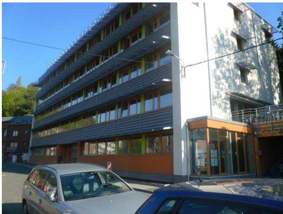
Mundo Namur – vue de la rue –