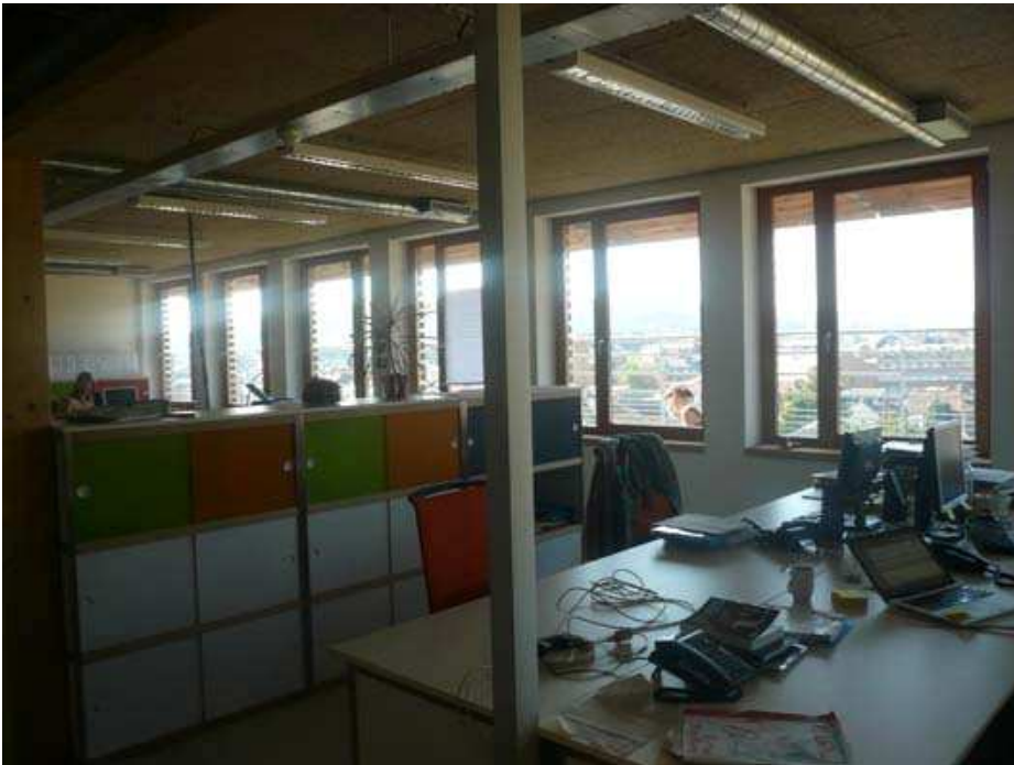
Les bureaux, lumineux ... Au loyer de 180   / mois par poste de travail