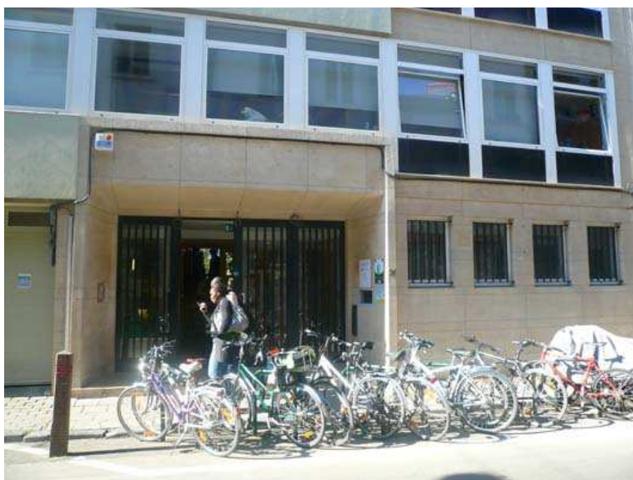
Le parking à vélo devant l'entrée de l'immeuble Mundo Bruxelles